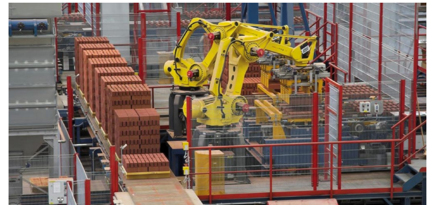
Aufreihlinien Marshalling lines

Das eingebaute sehr flexible Regelungssystem LINGL S7 WinCC erledigt die Regelung und Steuerung des Ofens und des Trockners nach dem neuesten Stand der Technik und ist zudem mit einem Hochgeschwindigkeitsmodem für die Fernunterstützung ausgestattet.