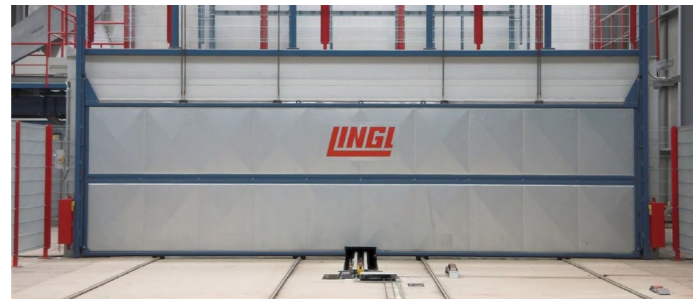
LINGL-Tunnelofen mit einer Länge von 176 m LINGL tunnel kiln 176 m long

Ab dieser Schnittstelle bis zum verpackten Ziegel hat LINGL das komplette Werk geplant, installiert und in Betrieb genommen.