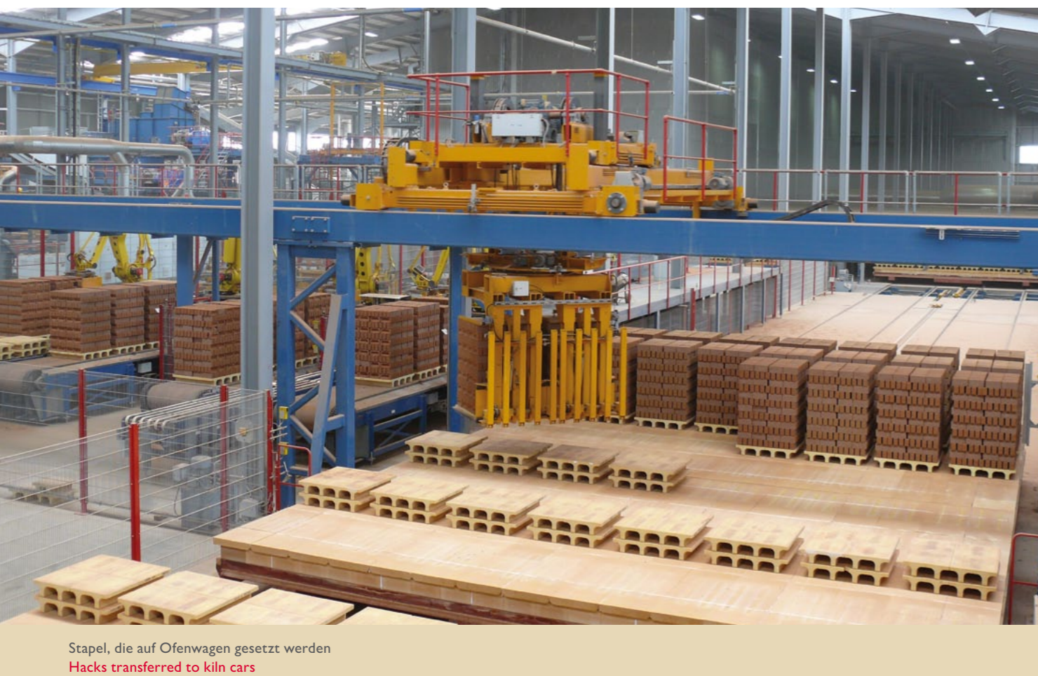
Stapel, die auf Ofenwagen gesetzt werden Hacks transferred to kiln cars

Auf brachliegendem Bauland, ca. 40 km von der englischen Großstadt Birmingham entfernt, wurde ein hoch modernes Werk mit komplexer energiesparender Ausrüstung und Einrichtung ausgestattet. Die Produktionsstätte in Measham wurde von der BCE (British Commitment to the Environment) für die Gebäudekonstruktion als auch für den Einbau energiesparender Ausrüstungen und Einrichtungen ausgezeichnet.