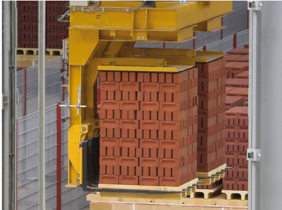
Stapelentladung mit Viaduktblöcken Hack unloading with viaduct blocks