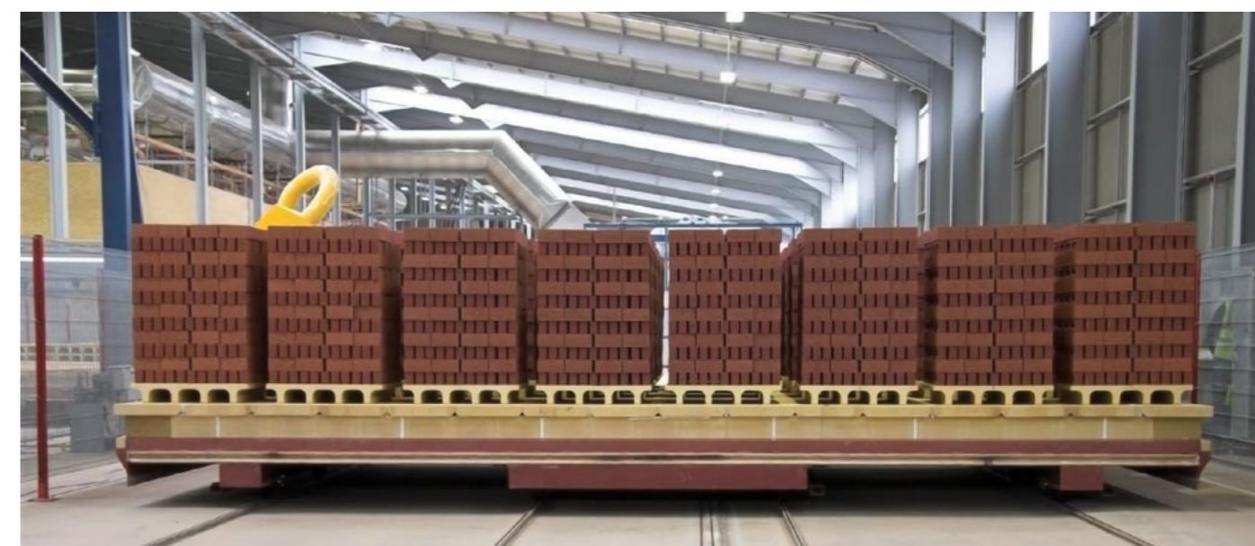
Ofenwagen (32 Stapel pro Wagen) Kiln cars (32 hacks per car)