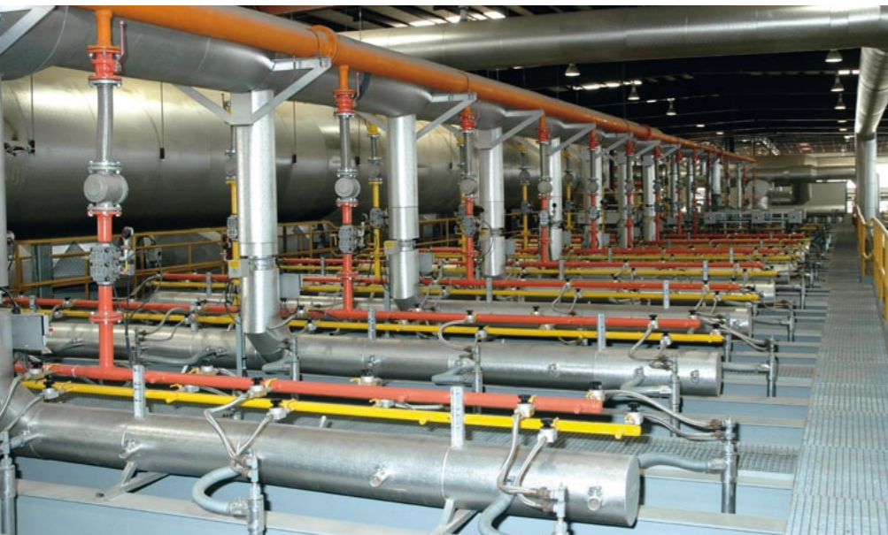
Dualbrennanlage für Biogas und Erdgas Dual fuel firing system for landfill gas and natural gas