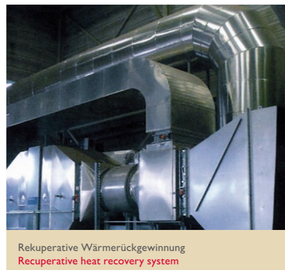
Rekuperative Wärmerückgewinnung Recuperative heat recovery system

Mit LINGL kommen Zukunftstechnologien schneller an ihr Ziel: in Ihr Ziegelwerk. LINGL stellt Ihnen green tec-Produkte zur Verfügung, mit denen Sie die Umwelt deutlich weniger belasten und dabei noch Ihre Kosten senken. Unsere Innovationen für effiziente Produktionstechnik sowie optimierte Prozesse entlang der Wertschöpfungskette haben wir unter dem Begriff „green tec by LINGL“ zusammengefasst.