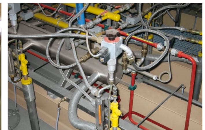
Dualbrennanlage für Pflanzenöl und Erdgas Dual fuel firing system for vegetable oil and natural gas