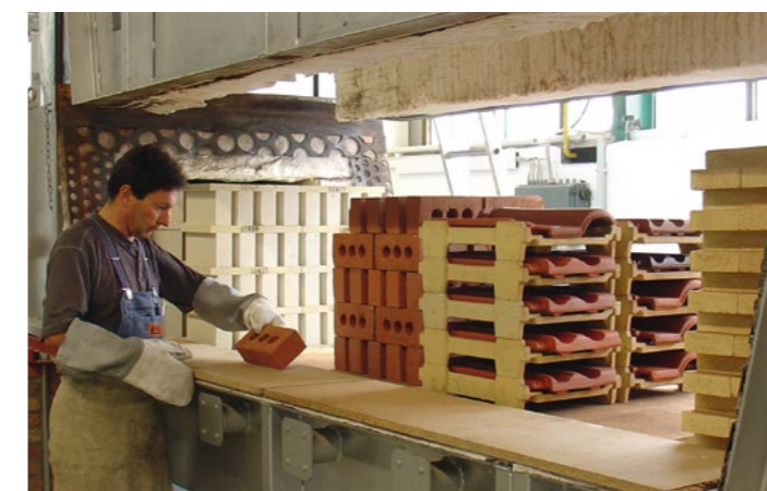
Prozess- und Rohstoffanalyse Process and raw material analysis