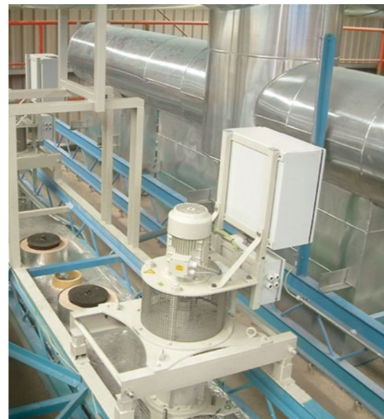
Heißgasumwälzung Hot air circulation system