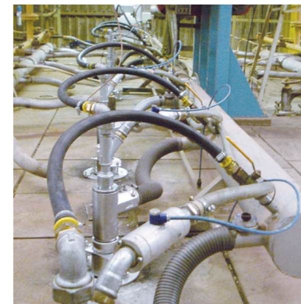
Festbrennstoff-Feuerung Solid fuel firing system

In either case we offer to you trend-setting efficiency solutions and comprehensive measure packages, which are fast-amortizing and which secure your leading position in competition.