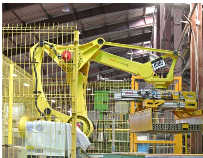
Разгрузочный робот Removing robot