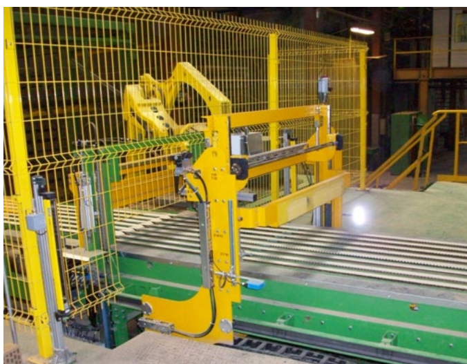
Группирующий толкатель, Устройство садки Grouping pusher, setting installation