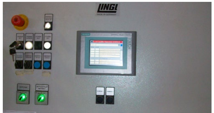
Пульт управления, Мокрая сторона Operator panel, wet side