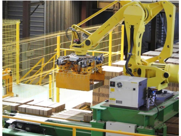
Садочный робот Setting robot