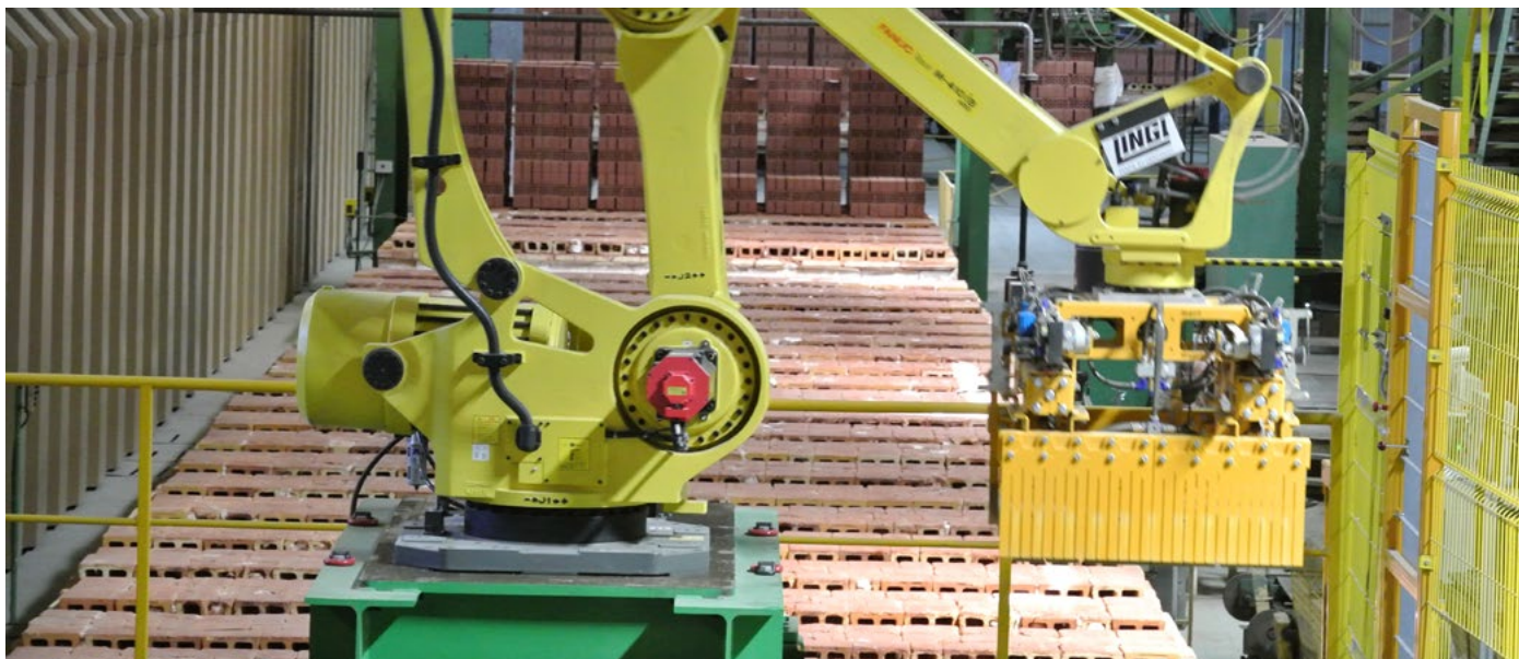
Садочный робот Setting robot